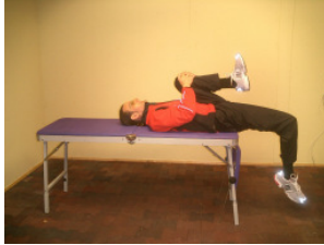
Positiv (5 Punkte)