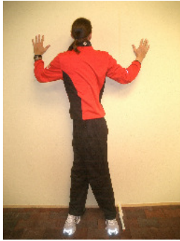
Positiv (5 Punkte)