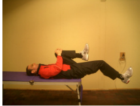
Mittel (3 Punkte)