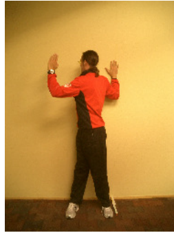
Mittel (3 Punkte)